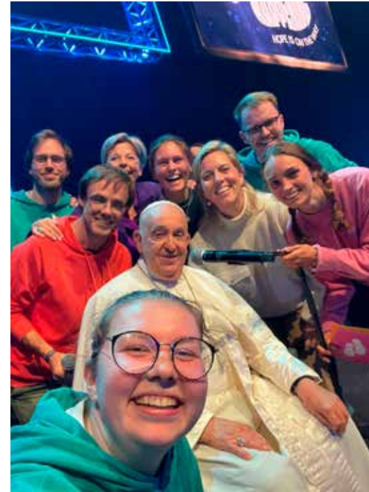
Paus Fransiscus op bezoek bij de jongeren

Het migratieprobleem moet goed aangepakt en bestudeerd worden en dat is jullie taak. De migrant moet worden opgevangen, begeleid, geholpen en geïntegreerd. Geen van deze vier dingen mag ontbreken, anders komen er echte problemen. Een migrant die niet geïntegreerd is, komt slecht terecht, maar dat