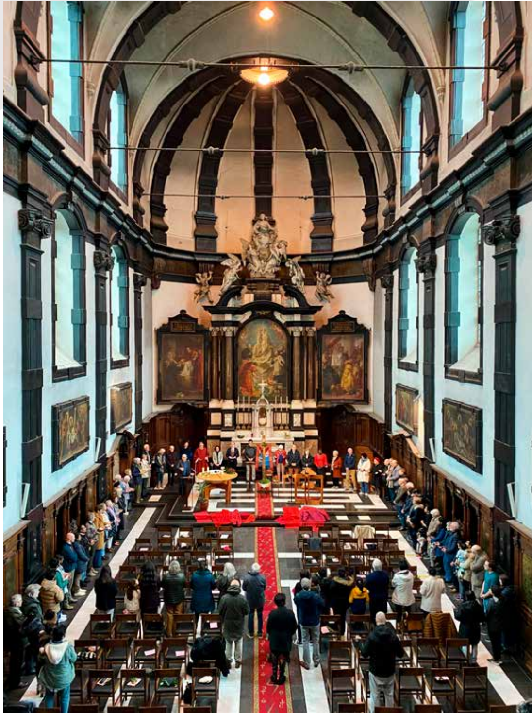
Palmzondagviering in de O.L.V. kerk van Leliëndaal.