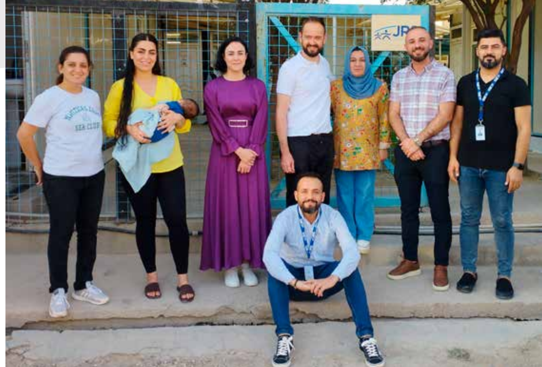
De directie van JRS in Sharya, september 2023

Wat mezelf betreft: ik woon als jezuïet alleen in het staff house , dus ook hier aan de grenzen van wat een jezuïetenleven zou kunnen zijn, daar waar de afstanden groot zijn, maar waar het hart die kan overbruggen. Omdat ik alleen woon besef ik beter wat de waarde is van het leven in een gemeenschap: gedragen worden door het gebed van anderen, geholpen worden en anderen van dienst zijn, zorg voor de medebroeders, de waarde ontdekken van