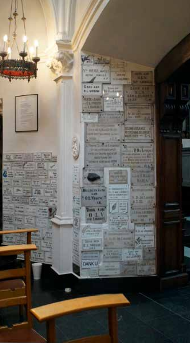
Gedeelte van de Lourdeskapel