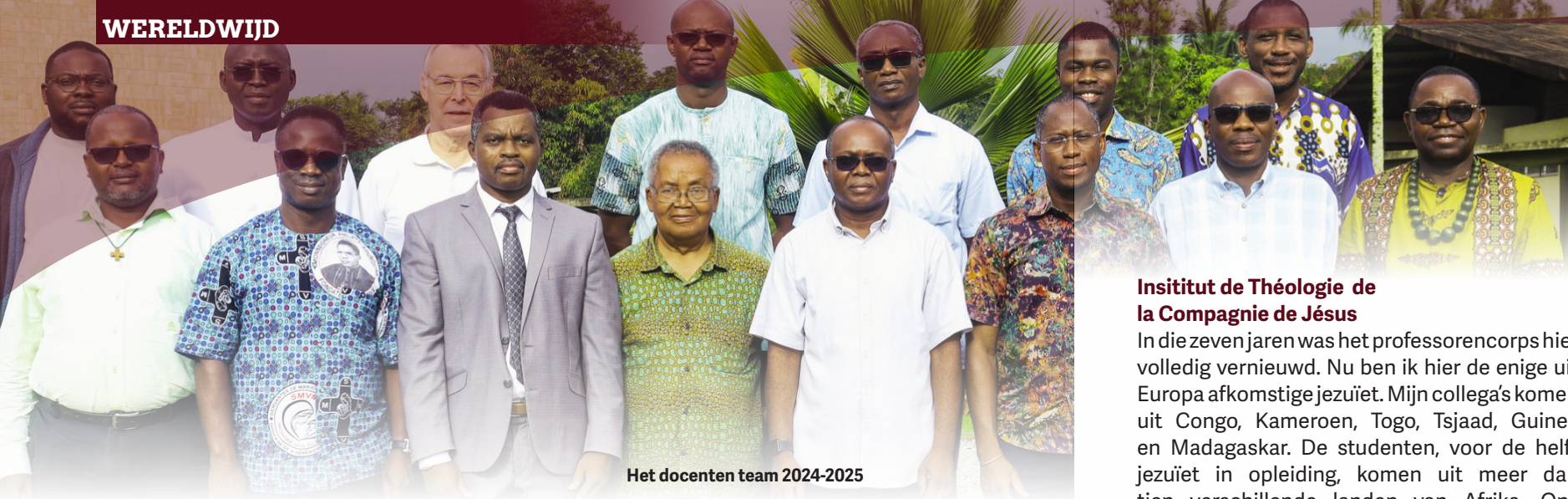
Het docenten team 2024-2025